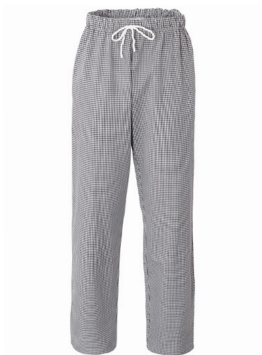
Q32 - Quadro nero